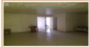
SALA COMEDOR DEPARTAMENTO