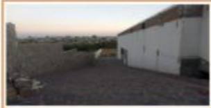
ACCESO VEHICULAR A ESTACIONAMIENTO